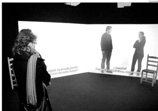
L'última part de l'exposició és un espectacle audiovisual.

En primer lloc, introdueix els visitants en un mapa de llengües únic de la zona i, posteriorment, els mostra els àmbits d'ús i els implica en un espectacle audiovisual.