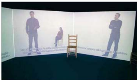
Un audiovisual mostra la gran diversitat lingüística de la Mediterrània ■ LINGUAMÓN