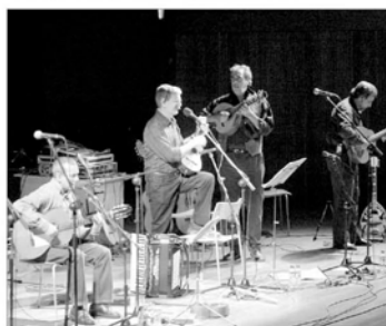
Moment de l'actuació del grup Al Tall.