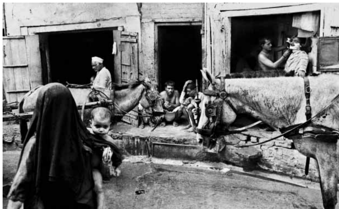
Barbero y caballos (Turkman Gate, Nueva Delhi, 1979) es una de las fotografías que se exhiben