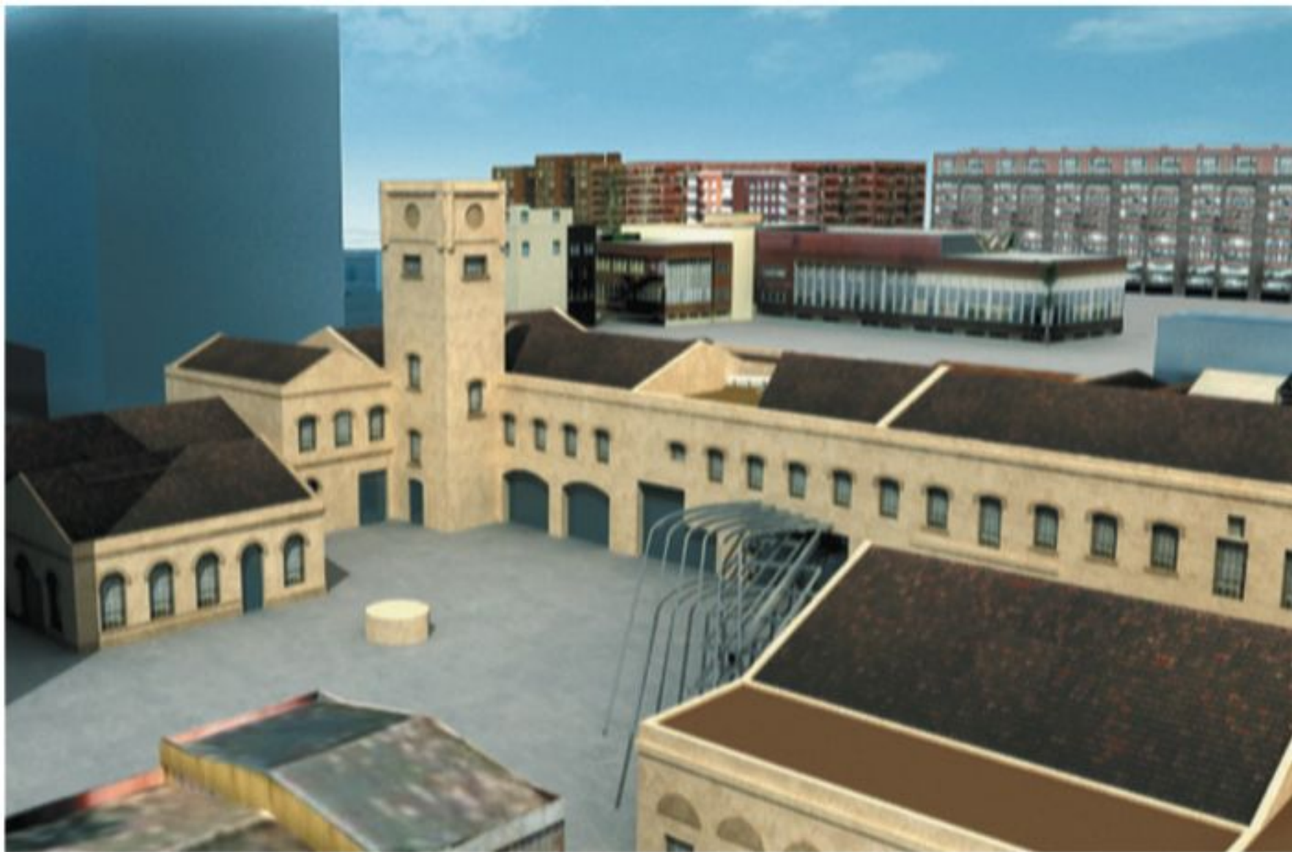
Imatge de la futura seu de Linguamón a Can Ricart